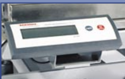
Digital Scale Elektronische Waage