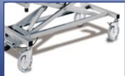
Short wheel base for more agility Kurzer Radabstand für mehr Beweglichkeit