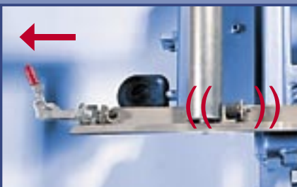
Lockable roller conveyor Arretierbare Rollenauflage