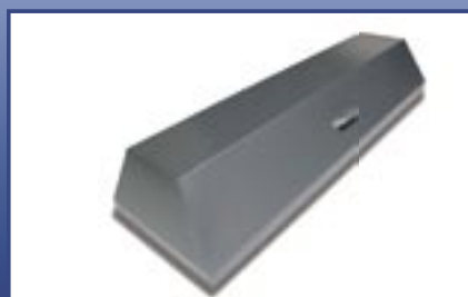
Cover for Mortuary tray made from aluminum or stainless steel Abdeckhaube für Leichenmulde in Alu / CNS