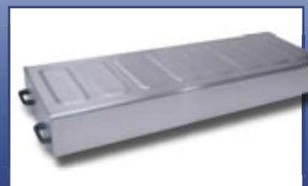
Cover for Mortuary tray with embossing Geprägte Abdeckhaube für Leichenmulden, Edelstahl