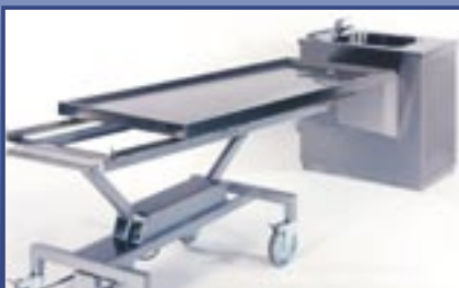
Fits any UFSK docking station Paßt perfekt zur Docking Station