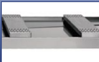
Stainless steel body supports Edelstahl Körperstützen