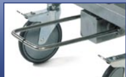
Double hydraulic unit Zweiarmlige Fuß-Hydraulik