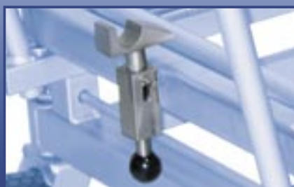
Security lock for body tray Sicherungsschloß für Leichenmulde